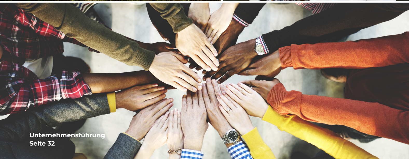
Unternehmensführung Seite 32