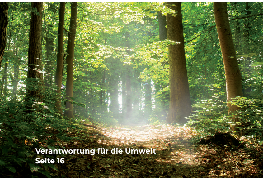
Verantwortung für die Umwelt Seite 16