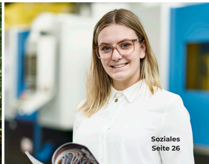
Soziales Seite 26