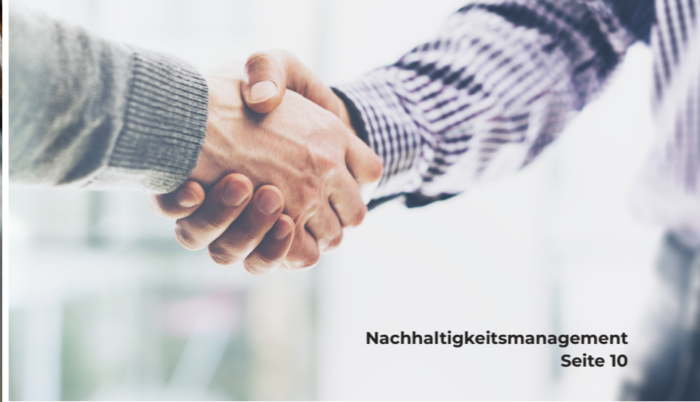
Nachhaltigkeitsmanagement Seite 10