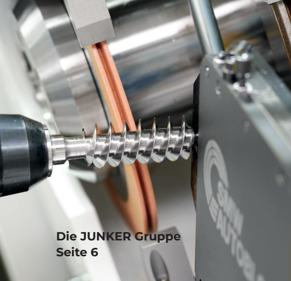
Die JUNKER Gruppe Seite 6